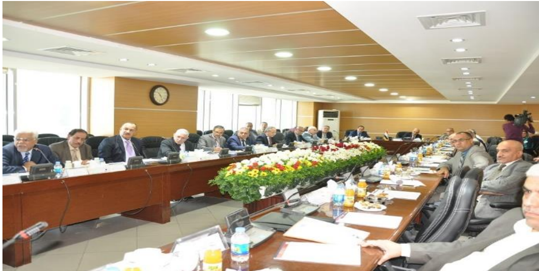
الاجتماع الثالث للجنة الفنية ٢٠١٤/٩/٣٠

رابعاً: تم عقد الاجتماع الرابع بتاريخ الاجتماع ٢٠١٤/١١/١١ برئاسة السيد بنكين ريكاني / الوكيل الفني لوزارة النقل وحضره (٢٤) عضو من مجموع (٣٤) وهم: