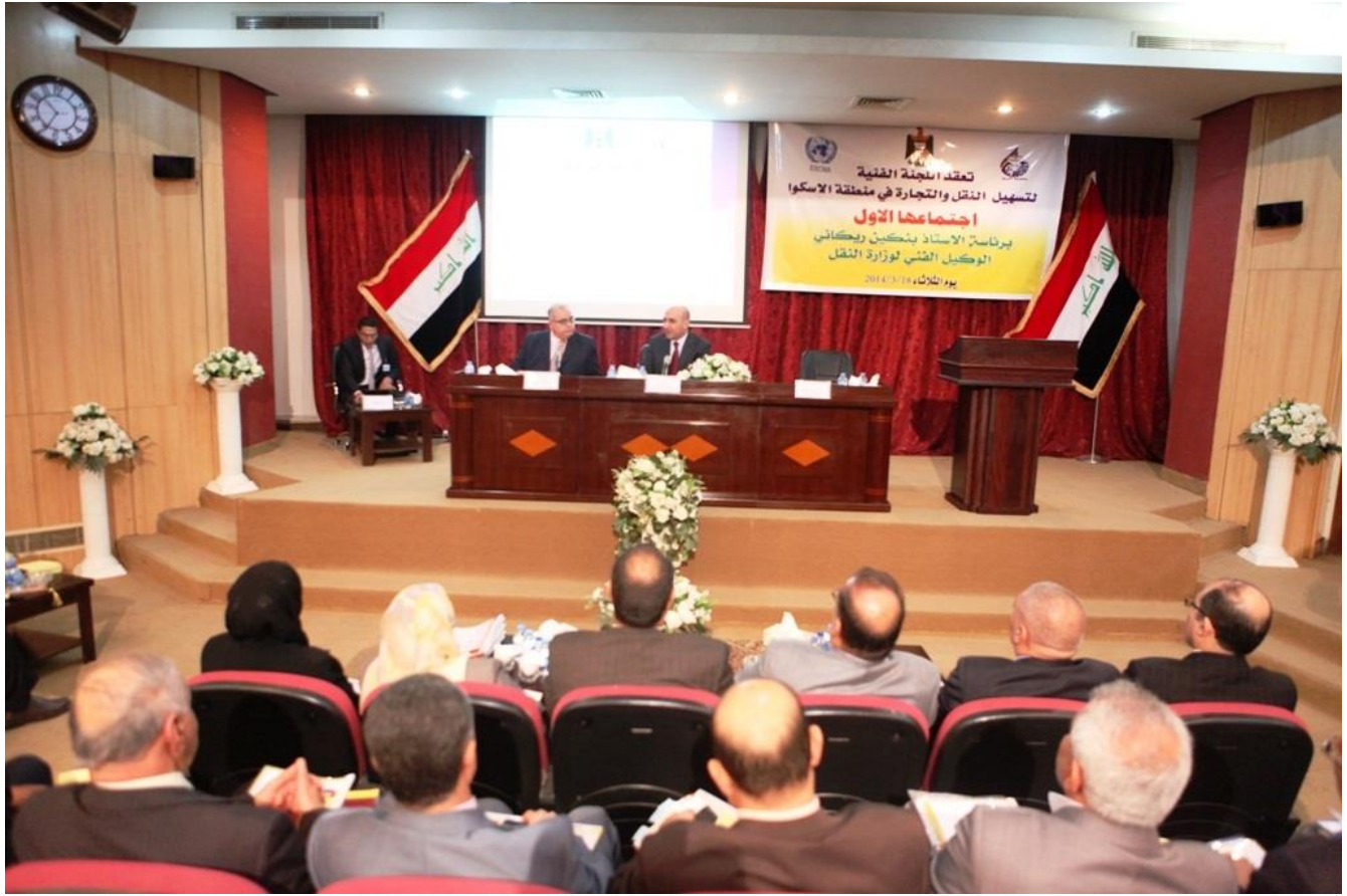
الاجتماع الاول للجنة الفنية ٢٠١٤/٣/١٨

٣. احلال اللجنة الوطنية لتسهيل النقل والتجارة في منطقة الاسكوا محل (اللجنة العليا للنقل المستدام) الواردة في مشروع قانون النقل المستدام لتشابه الأعضاء والمهام والواجبات بين اللجنتين .