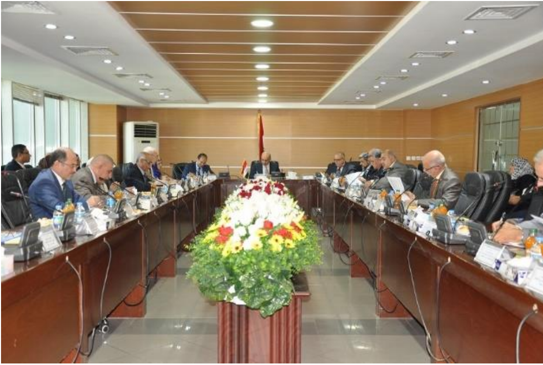
الاجتماع الخامس للجنة الفنية ٢٣/١٢/٢٠١٤

١٦. أ. تكليف مدير الشركة العامة لموانئ العراق بالتأكد من الموضوع والايجاز لمنسوبي الشركة بعدم تنفيذ قرار مجلس محافظة البصرة المتعلق بفرض رسم ١% على جميع البضائع المستوردة عبر منافذ البصرة كون القرار مخالف للقانون . ب. التوصية الى اللجنة الوطنية لمفاتيحة الأمانة العامة لمجلس الوزراء حول موضوع فرض رسم ١% من قبل مجلس محافظة البصرة على جميع البضائع المستوردة عبر منافذ البصرة وأجبار الدوائر الكمركية على عدم ترويج أية معاملة ما لم تستحصل هذه الرسوم .