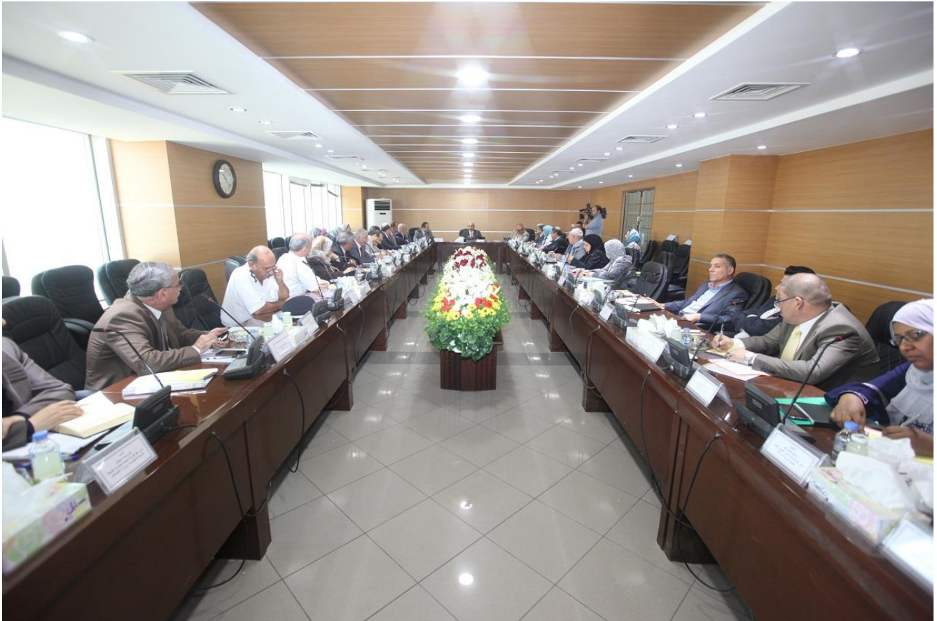
الاجتماع الثاني للجنة الفنية ٢٠١٤/٨/١٨

١٤. التأكيد على ممثلي الوزارات المعنية بالإسراع بتزويد الأمانة التنفيذية بأسماء ممثليها في لجنتي توحيد جهات الفحص واتلاف البضائع لغرض اصدار الأوامر الوزارية ومباشرة اللجنتين بمهامهما .