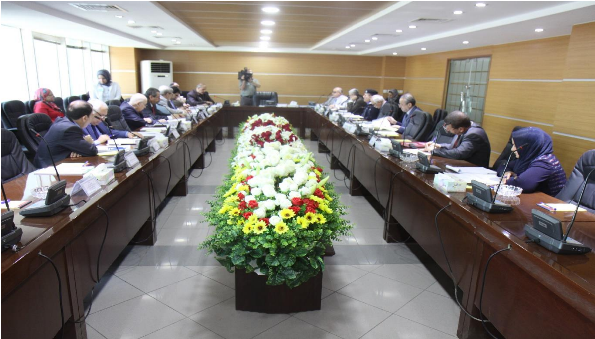
الاجتماع الثالث للجنة الوطنية ٢٠١٤/٧/٧