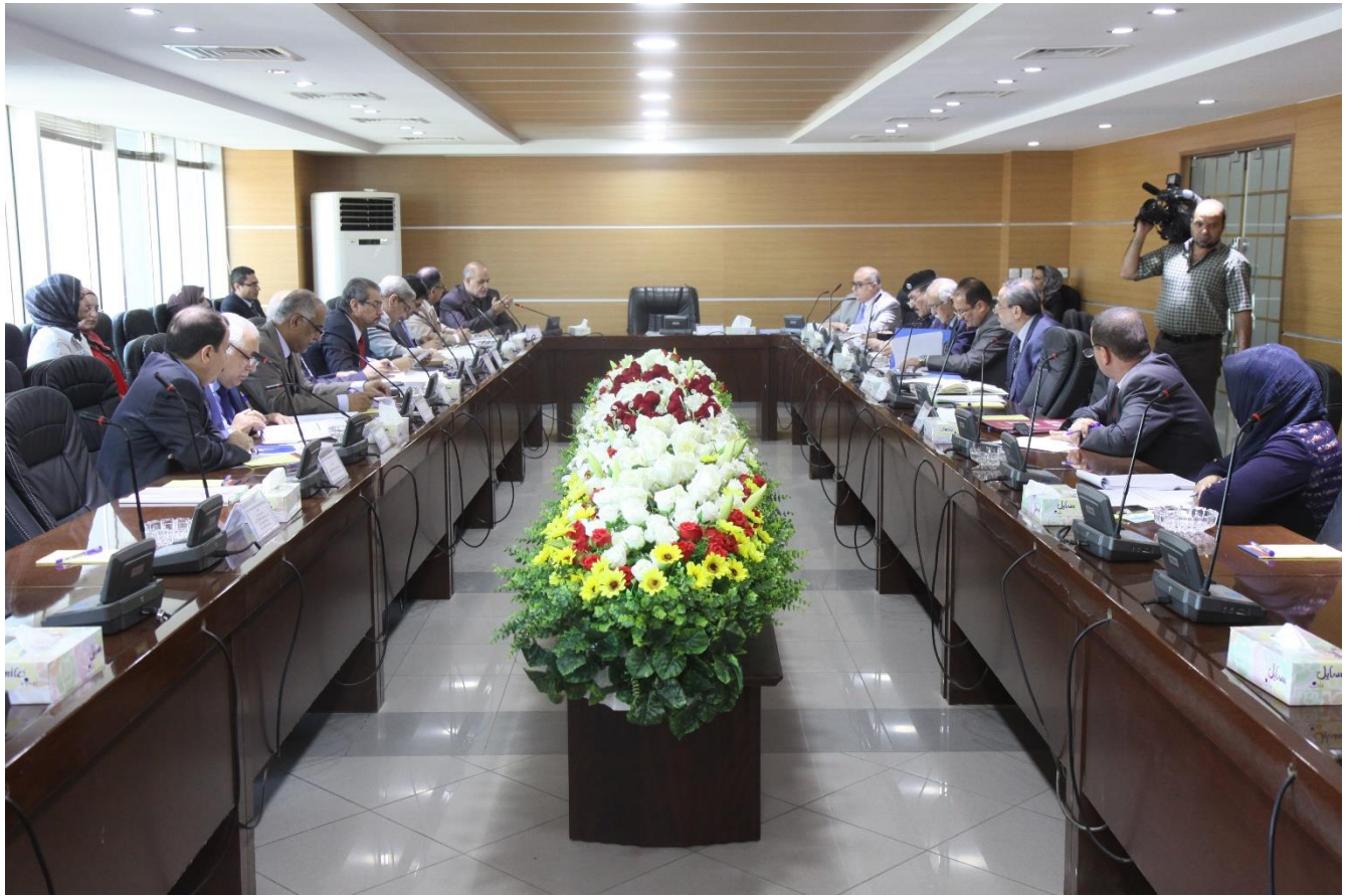
الاجتماع الرابع للجنة الوطنية ١٩ / ١١ / ٢٠١٤