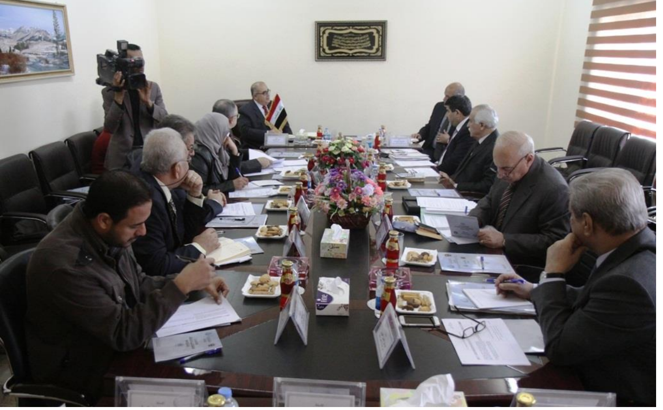
الاجتماع الخامس للجنة الوطنية ١٧ / ١٢ / ٢٠١٤