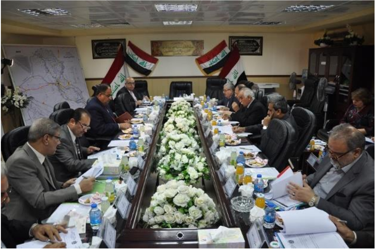
الاجتماع الاول للجنة الوطنية ٢٠١٣/١٠/٣٠

و. تقوم الوزارات والجهات المعنية الاخرى ( حكومية وخاصة ) بعرض مقترحاتها والمشاكل والمعوقات التي تواجهها على اللجنة الفنية من خلال الامانة التنفيذية لغرض دراستها حسب الاصول .